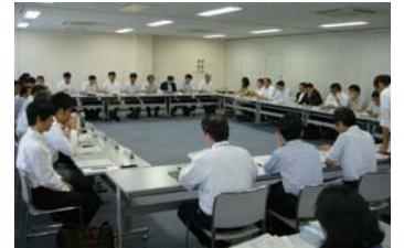
近畿圏広域地方計画協議会 第6回幹事会(平成22年6月23日開催)

なお、進捗状況の公表資料全文は、インターネット経由で以下のページから入手できます。 http://www.kkr.mlit.go.jp/kokudokeikaku/program/data/2010/pub_20100630/index.html