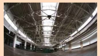
旧神戸生糸検査所