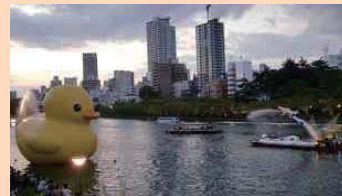
水都大阪2009