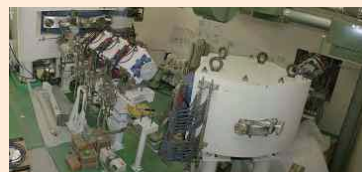
BNCTに適した強度の中性子を発生させることのできる小型加速器

■からだにやさしい究極のピンポイントがん治療「ホウ素中性子捕捉療法(BNCT)」の早期実用化を目指して、研究が行われています。