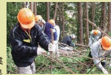
森林保全作業