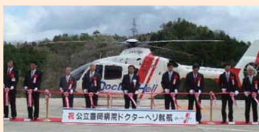
3府県共同ドクターヘリの就航式(豊岡市)

■兵庫県、京都府、鳥取県及び公立豊岡病院組合の4者による運航協定書が締結され、共同運航を開始しています。