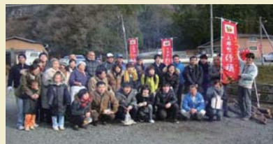
小規模集落元気作戦

■人口が減少し、高齢化が進んだ小規模な集落を対象に、「交流」をキーワードとした集落再生への取組を支援するモデル事業を展開しています。