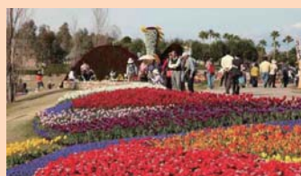
淡路花博2010花みどりフェア