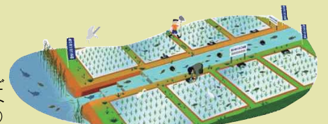
魚のゆりかご水田プロジェクト(イメージ図)