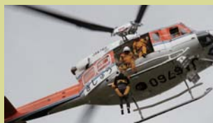
2府7県合同防災訓練

■福井県嶺北北部を震源とする大規模地震を想定し、2府7県(福井県、三重県、滋賀県、京都府、大阪府、兵庫県、奈良県、和歌山県、徳島県)が参加する合同防災訓練が実施されました。