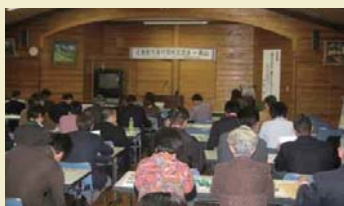
都市農村交流現地研修会

■NPO 法人の民間団体を対象とした「都市農村交流現地研修会」等の開催を通じ、都市農村交流等の普及啓発活動を実施しました。