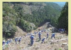
森林保全作業