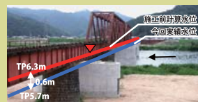
平成21年8月9日(台風9号影響)洪水における円山川の河川改修

■平成21年8月の台風9号の影響による円山川の洪水では、集中的に実施した河川改修により、河川の水位を大幅に下げたことが確認されました。