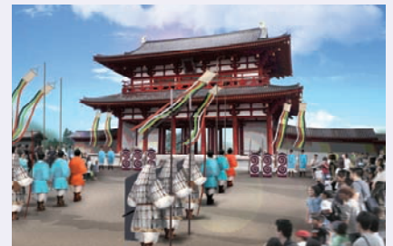
朱雀門広場イメージ

平城遷都1300年を機に、 日本の歴史・文化が連綿と続いたことを “祝い、感謝する” とともに “日本のはじまり 奈良” を素材に、 過去・現在・未来の日本を “考える”