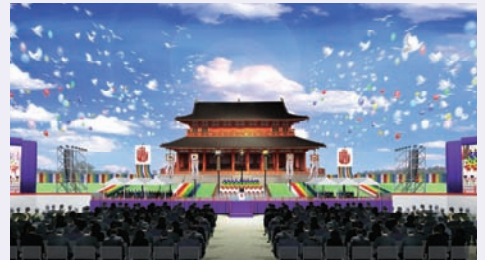
平城遷都1300年記念祝典イメージ