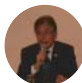
平松市長 大阪市長