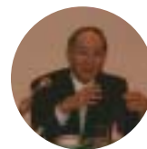
下妻会長 関西経済連合会会長