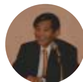
仁坂知事 和歌山県知事