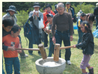
レクリエーション交流