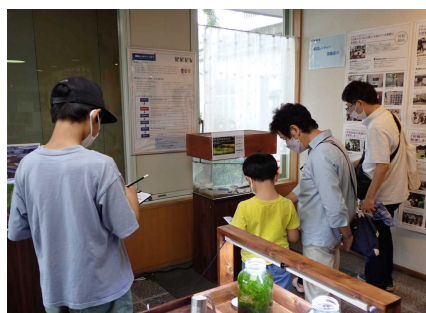
ワークショップのようす②