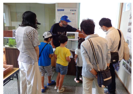
ワークショップのようす③