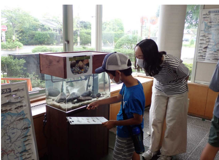
ワークショップのようす①