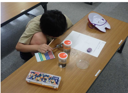
水生生物の学習会のようす①