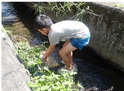
水生生物調査のようす④