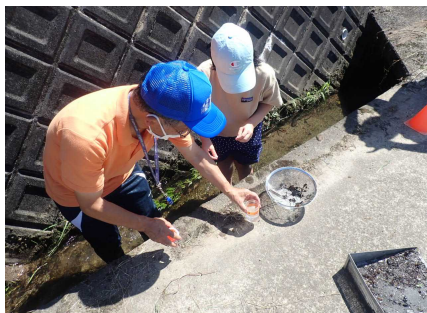
水生生物調査のようす①