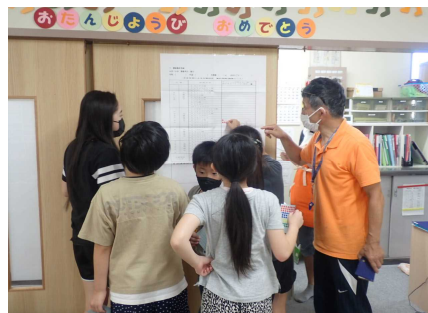
水生生物の学習会のようす③