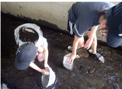
水生生物調査のようす③