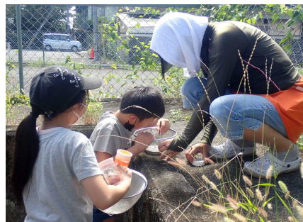
水生生物調査のようす⑤