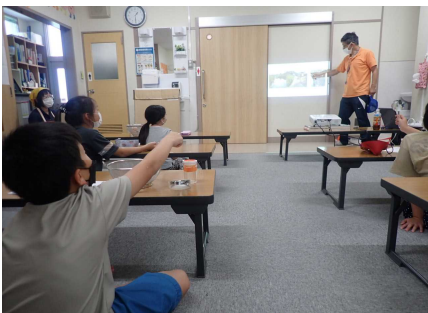
オリエンテーションのようす