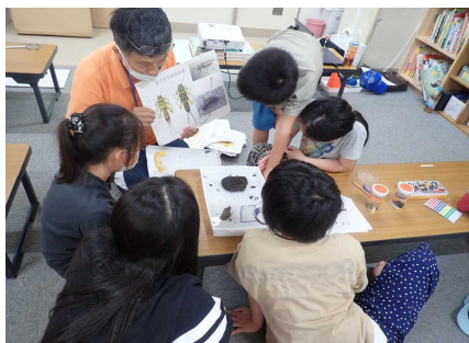
水生生物の学習会のようす②