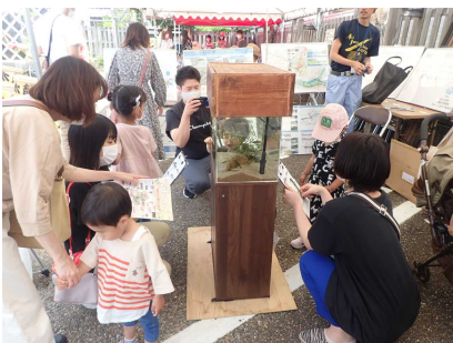
ワークショップのようす③