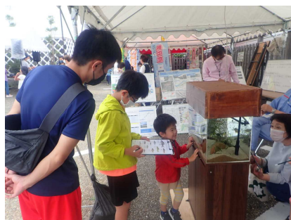
ワークショップのようす①