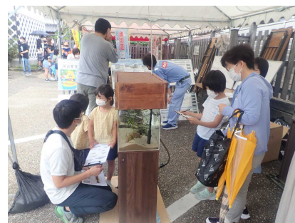
ワークショップのようす②