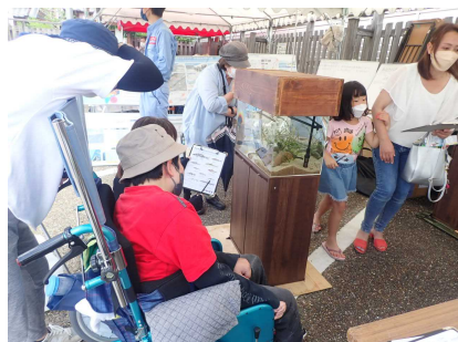
ワークショップのようす④