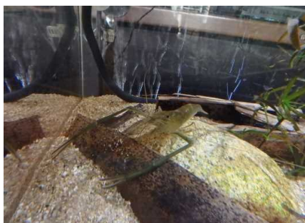
市民センターでの展示状況④