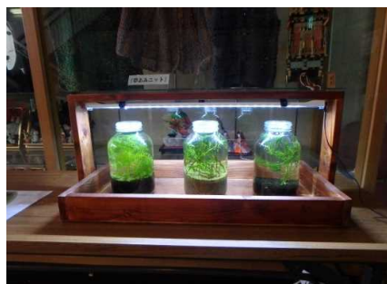
市民センターでの展示状況⑤