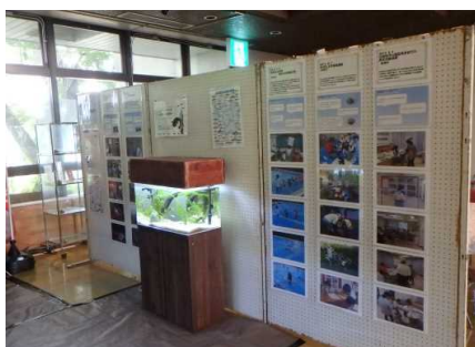
市民センターでの展示状況⑦