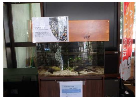
市民センターでの展示状況③