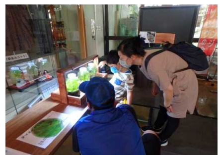
ワークショップのようす②