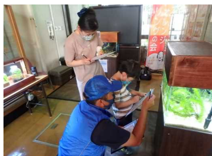
ワークショップのようす①