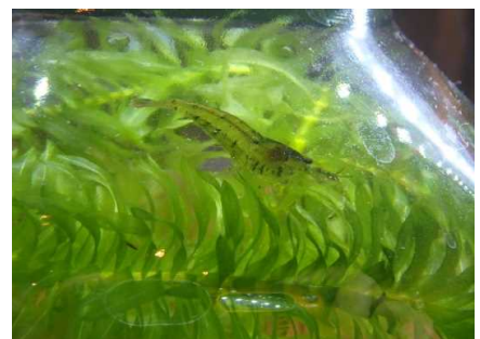
市民センターでの展示状況⑥