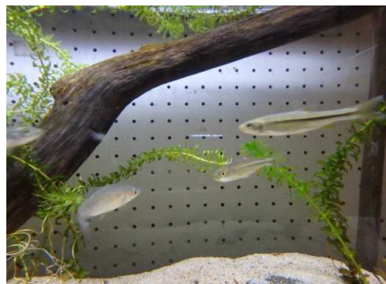
市民センターでの展示状況②