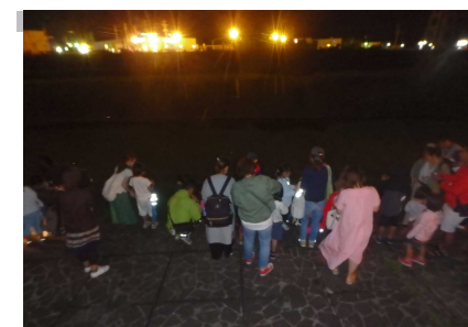
ホタル観賞のようす③(6/15)