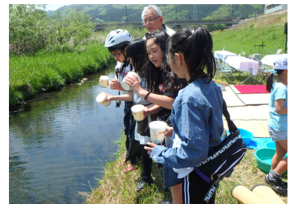
カワニナの放流のようす①(5/2)