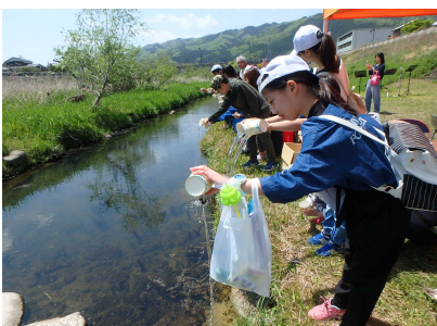
カワニナの放流のようす②(5/2)