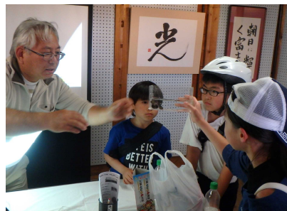
ホタルとカワニナの学習会②(5/2)