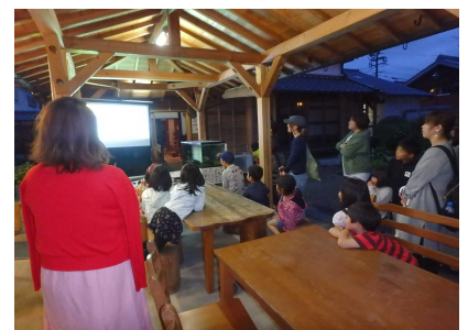
ホタルに関する学習会②(6/15)