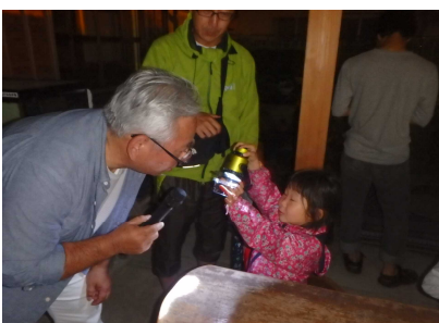
ホタル観賞のようす①(6/15)