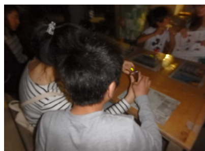
ホタル観賞のようす②(6/15)