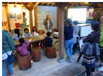
ホタルに関する学習会①(6/15)