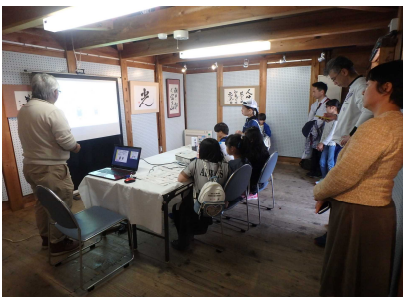
ホタルとカワニナの学習会①(5/2)