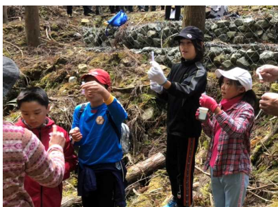
水質調査のようす