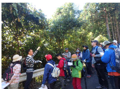
薬草観察のようす①