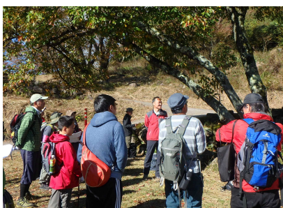
活動前のミーティング