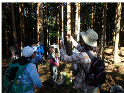
薬草観察のようす③