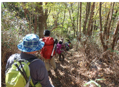
屏風岩登山のようす