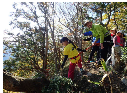
屏風岩から下界をみるようす