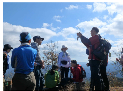
地形について説明のようす