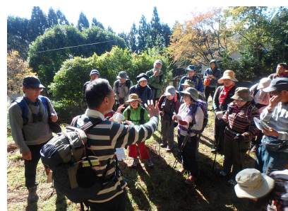
薬草観察のようす②