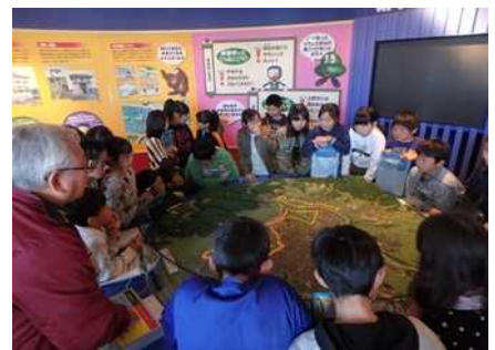
模型での説明のようす