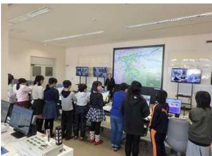
集中管理センター見学のようす①