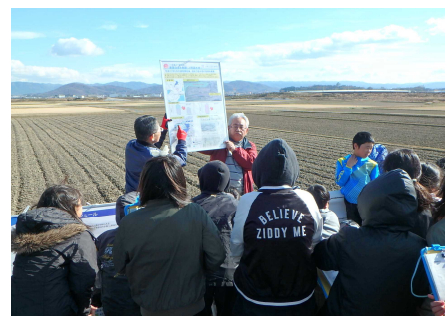
遊水地見学のようす②