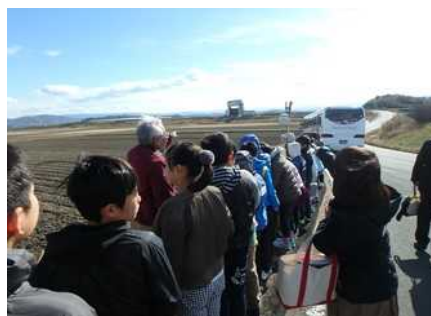
遊水地見学のようす①