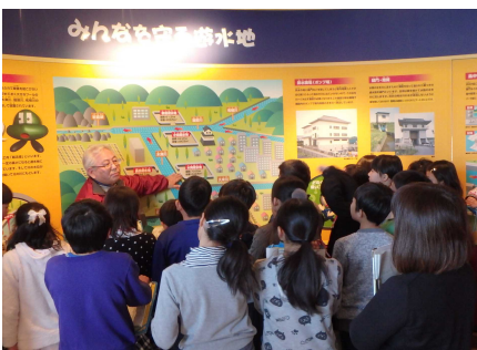
パネルでの説明のようす