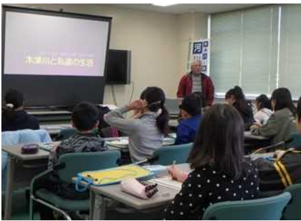
遊水地学習のようす①