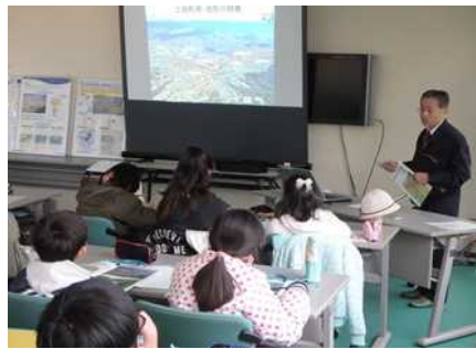
遊水地学習のようす②