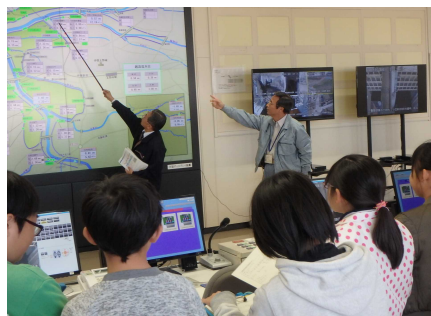
集中管理センター見学のようす②