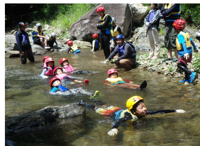
リバートレッキングのようす①