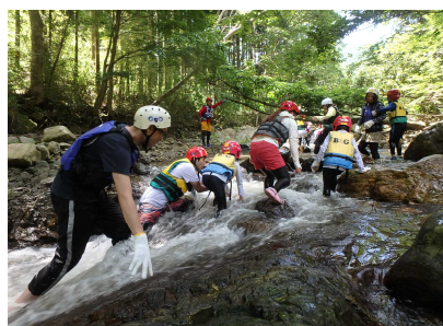
シャワークライミング体験のようす①