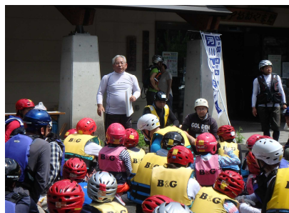
活動前のミーティング