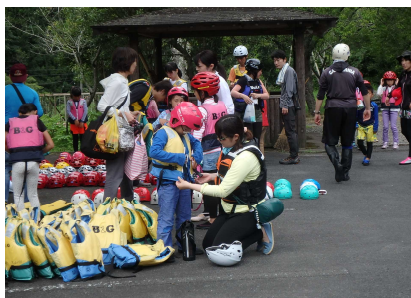
ライフジャケット着用のようす