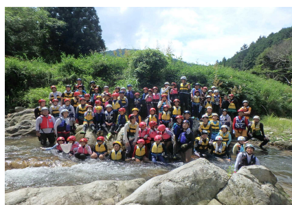
全員で記念写真撮影