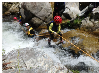
シャワークライミング体験のようす②