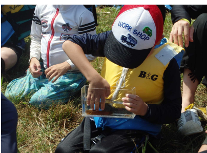
水生生物調査のようす②