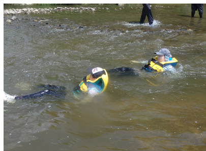
川上り・川下りのようす③