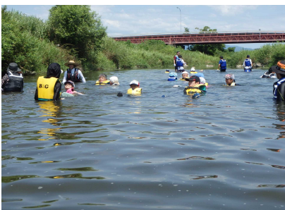
川上り・川下りのようす②