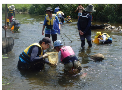
水生生物調査のようす③