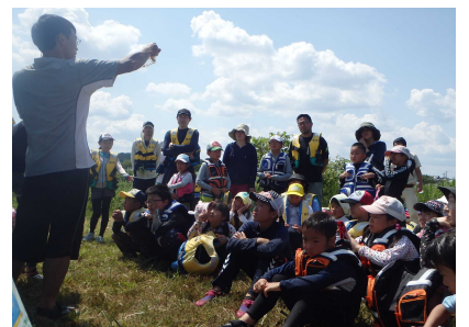
水生生物調査のようす①