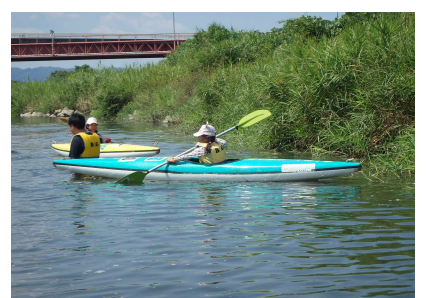
カヌー体験のようす