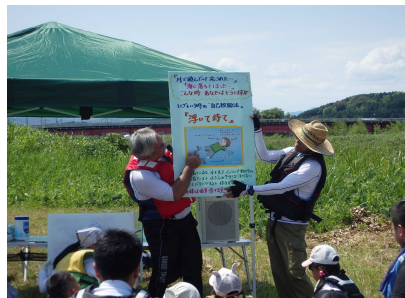
活動前のミーティング