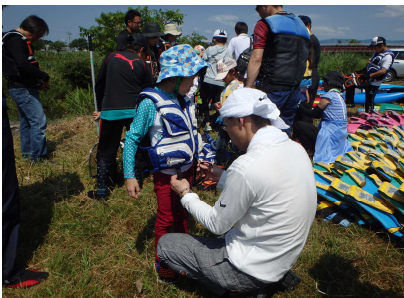
ライフジャケット着用のようす