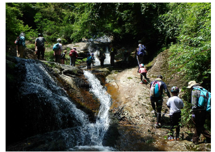
リバートレッキングのようす①