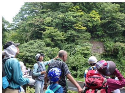
植物観察のようす①