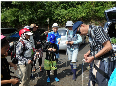
ロープワークのようす①