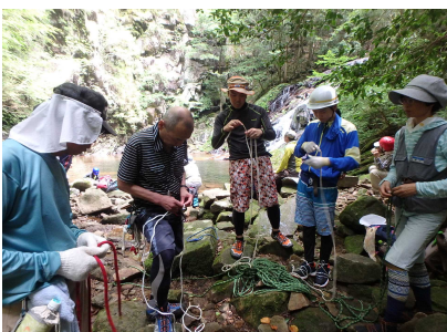
ロープワークのようす②