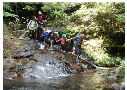
リバートレッキングのようす④