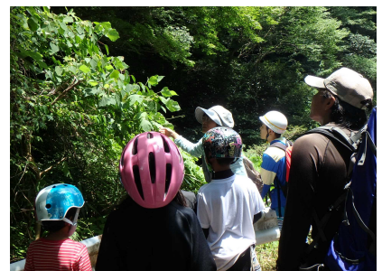
植物観察のようす②