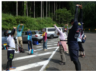
活動前の準備運動