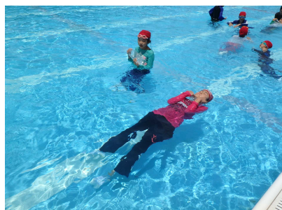
着衣水泳体験のようす⑥