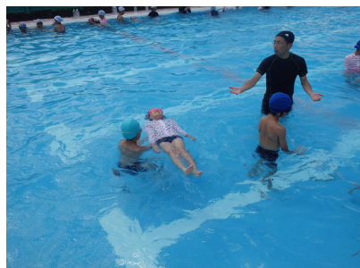
着衣水泳体験のようす②