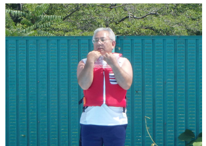
ペットボトルでの浮遊体験の説明