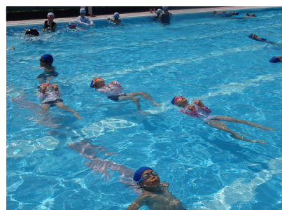
着衣水泳体験のようす③