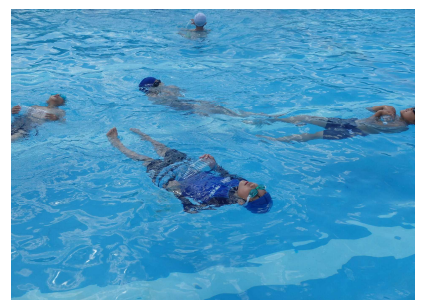
着衣水泳体験のようす④