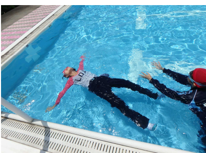
着衣水泳体験のようす⑤