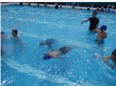
着衣水泳体験のようす①