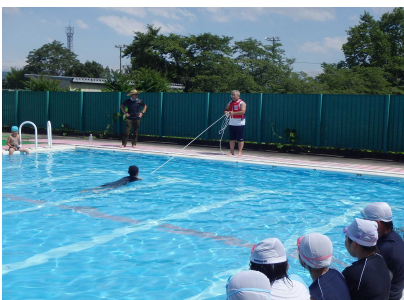
ペットボトルでの浮遊体験の説明