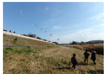
名張川にて連凧あげ