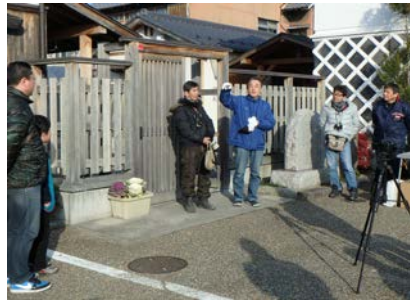
野鳥観察についての説明②