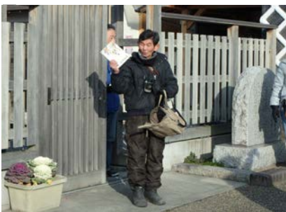
野鳥観察についての説明①