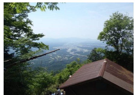
忍者岳からの景色