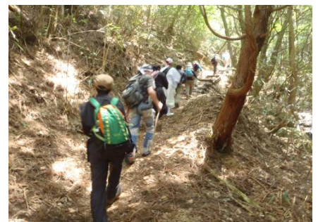
源流探検のようす ②