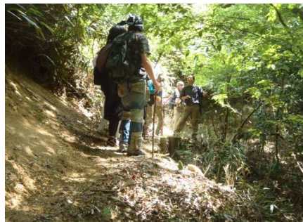
薬草観察・環境学習のようす ②