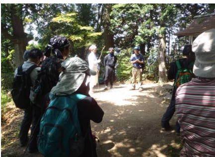
薬草観察・環境学習のようす ④