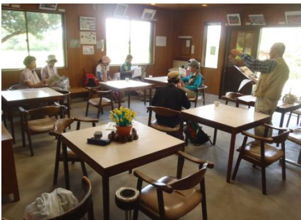
薬草観察・環境学習のようす ①