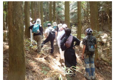
薬草観察・環境学習のようす ③