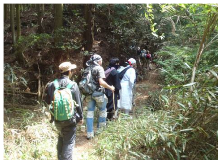
源流探検のようす ①