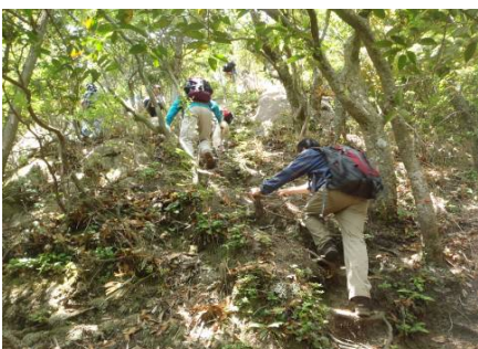
源流探検のようす ③