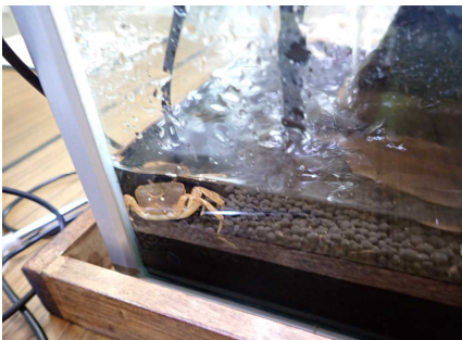
サワガニ展示のようす