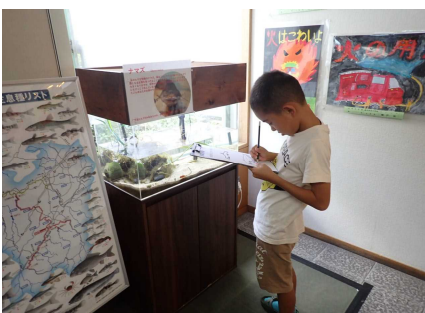
ワークショップのようす①