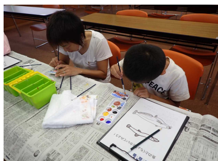
ワークショップのようす②