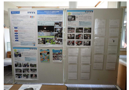
レンジャー活動の紹介