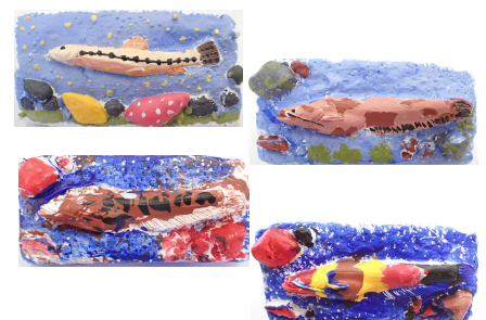
完成した立体塗り絵