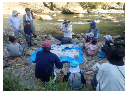
岩石・地質の学習