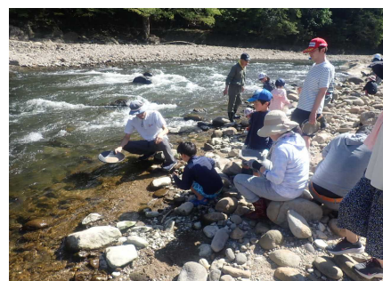
ガーネット採集方法の説明