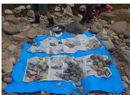
岩石収集のようす