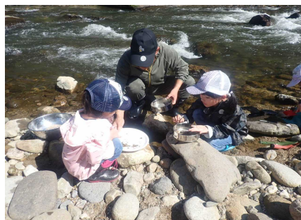
ガーネット採集のようす③