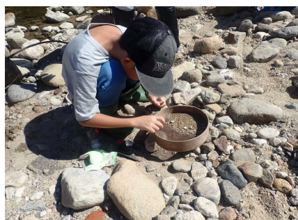
ガーネット採集のようす①