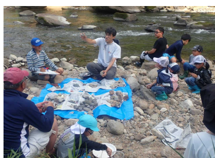
岩石の説明・観察