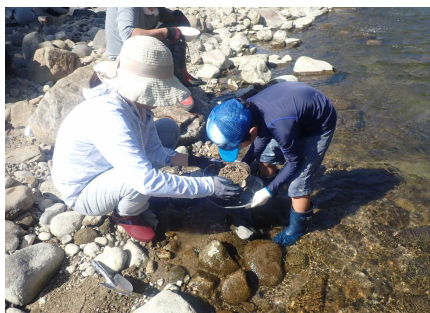
ガーネット採集のようす②