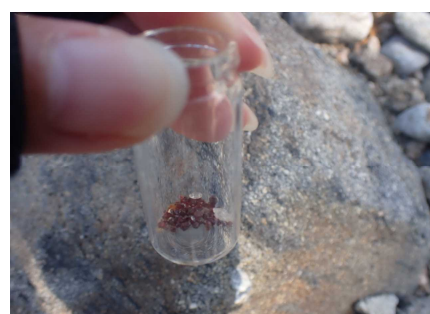
採集したガーネット