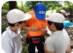
◆天満川の生き物調べと水質判定