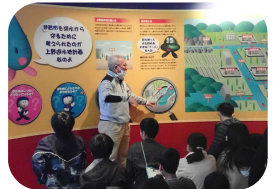
◆上野北小学校遊水地学習