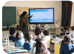
◆名張小学校出前講座