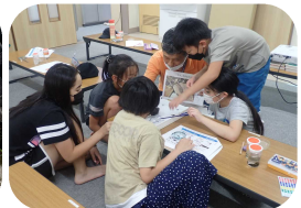
◆水辺の生物を観察し、水の汚れを生物にたずねてみよう