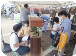
◆やなせ祭りでの生き物展示【やなせ宿】