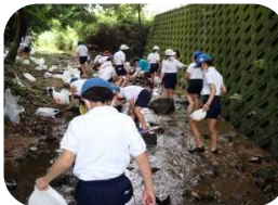
◆天満川の生き物調べと水質判定