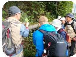
◆青蓮寺川源流探検