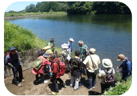
◆柘植のため池巡り