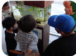
◆木津川のいきもの展【ハイトピア伊賀】