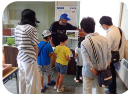
◆名張川のいきもの展【名張市立図書館】