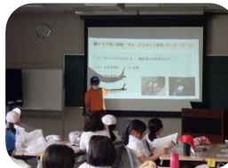
◆天満川の生き物調べと水質判定