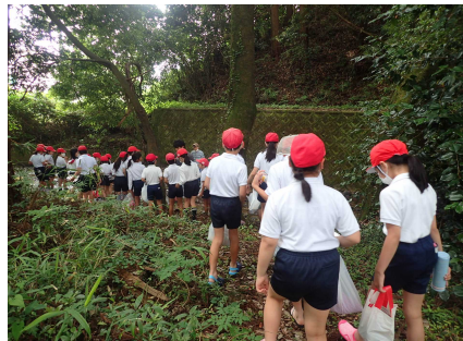
川への移動のようす