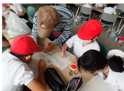
観察・記録のようす②