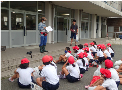
オリエンテーリングのようす