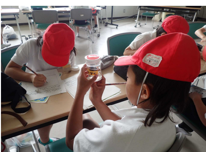
観察・記録のようす①