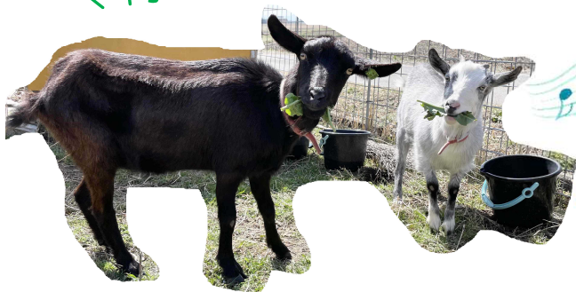
水を入れたバケツ