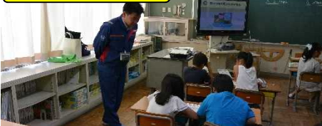
状況によって避難するかどうか、考えて各自の意見を発表