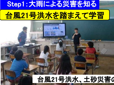
台風21号洪水、土砂災害の様子を地域の写真を交え説明