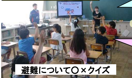
避難について〇×クイズ

【問題】(〇×クイズ) ・避難所とは災害が起きそうなときに逃げ込める場所である？