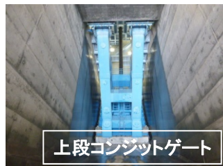
上段コンジットゲート