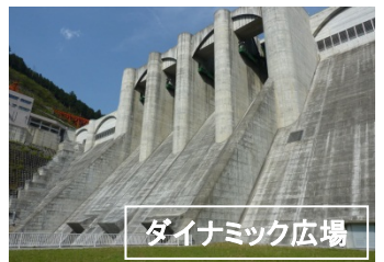
ダイナミック広場

大滝ダムでは、7月26日に「大滝ダム体験ツアー」と題したダム見学イベントを開催します。