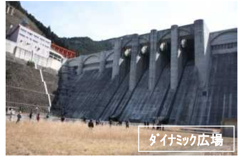
ダイナミック広場