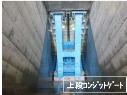
上段コンジットゲート