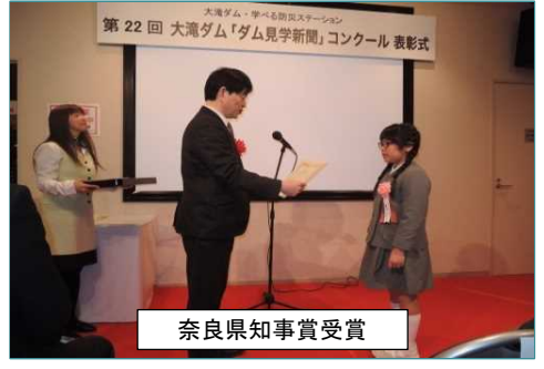
奈良県知事賞受賞