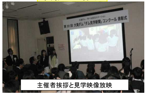
主催者挨拶と見学映像放映