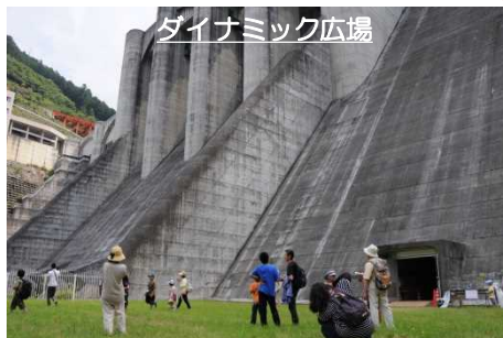
ダイナミック広場