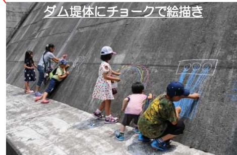
ダム堤体にチョークで絵描き