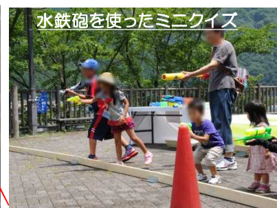
水鉄砲を使ったミニクイズ