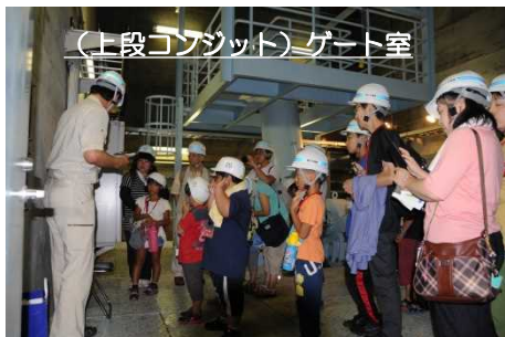
(上段コンジット)ゲート室

主な内容は、ダム見学や大滝ダム・学べる防災ステーションの豪雨体験、ダム堤体への絵描き、水鉄砲を使った大滝ダムや治水に関するミニクイズを実施し、ダムの役割や治水について理解を深めていただきました。