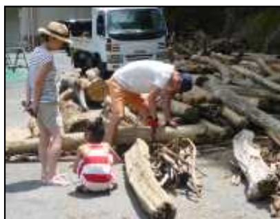
流木を選んでいる様子