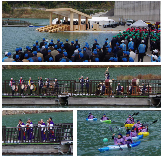
▲ 水上歓迎行事の様子

紀の川ダム統合管理事務所では、会場周辺整備を奈良県や川上村と分担しながら準備を進めてきました。