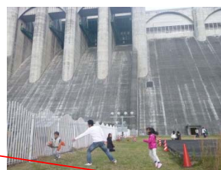
ダイナミック広場