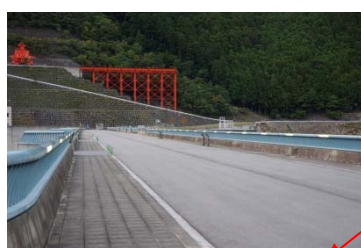
大滝ダムの空みち