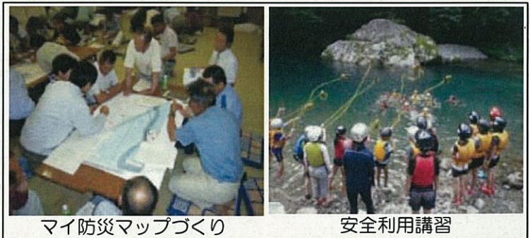
マイ防災マップづくり