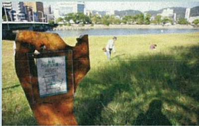
市民団体による看板設置事例（太田川）