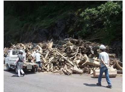
流木を選定している様子