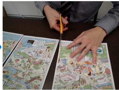
②山折り部分の裏側の余白を切り取る。