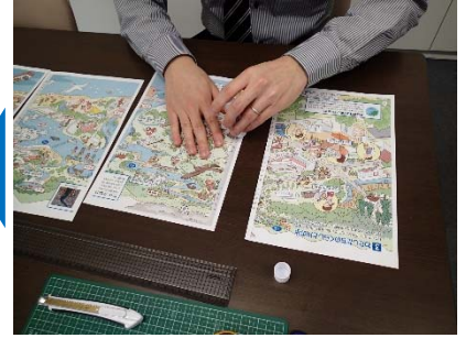
④のりしろ部分にのり付けをする。