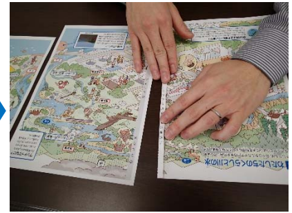
③山折り部分を折る。