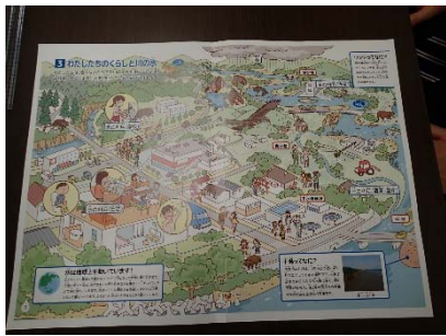
⑥見開き (片面) が完成。もう片面も同様に②～⑤を行う。