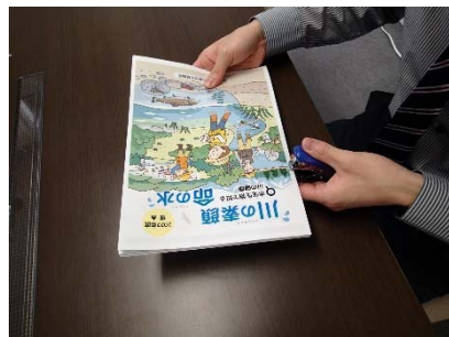
⑧作成した見開きを含めたすべての冊子をホッチキスで止める。