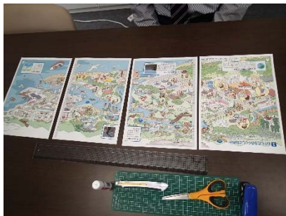
①のり、はさみ (またはカッターナイフ)、ホッチキスを用意する。