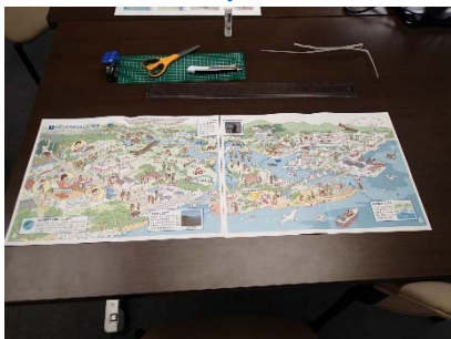
⑦見開き (両面) が完成。