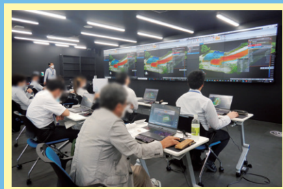
3次元データの操作実習