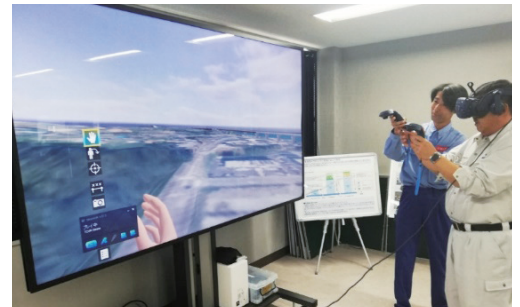
新宮道路VR体験状況

日 時：令和5年10月18日(水) 13時30分～15時00分 場 所：新宮河川国道維持出張所 (新宮インフラDX推進センター) 参加者：新宮地方建設業協同組合12名