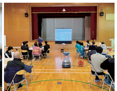
12/6熊野川中学校(新宮市)