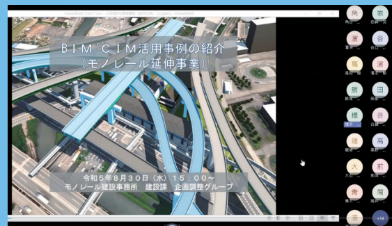
WEB研修の様子(モノレール)