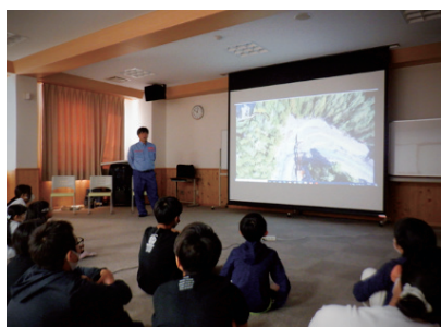
10/3成川小学校(紀宝町)

新宮地域のインフラDXに関する認知度向上、および、建設業界の担い手確保に寄与するため、小中学校の学生を対象とした出前授業を実施し、一定の理解と興味を持ってもらいました。