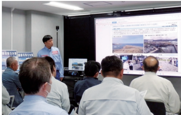
インフラDX概要・出張所取組の説明状況