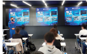
インフラDXの概要説明