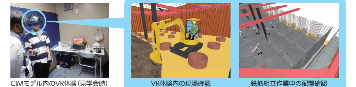
CIMモデル内のVR体験(見学会時)

その2：CIMモデルを用いたVRによる工事現場見学会の実施 将来の担い手確保を目的として中学生から大学生を対象に、CIMモデル内VR空間による現場見学会を実施した。実際の重機の可動域の確認や鉄筋組立時の人員配置確認など建設現場の取り組みをより具体的に体感してもらうことができ、「建設現場のVR体験ができるとは思わなかった」「将来こういう現場で仕事したい」などの意見をいただいた。