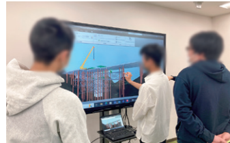
3D設計モデル操作体験

近畿インフラDX推進センターでは、4つの見学コースを設けており、動画の視聴や3Dモデルの操作体験なども含めて、各コース約1時間で施設内をご覧いただけます。(設定したコース以外の内容でもご要望に合わせて、ご案内いたします。)