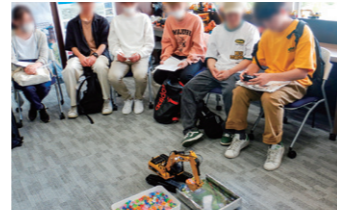
バックホウラジコン操作体験

近畿インフラDX推進センターでは、随時施設見学を受け付けております。ご興味のあるかたはぜひ、下記HPよりお申し込みください。