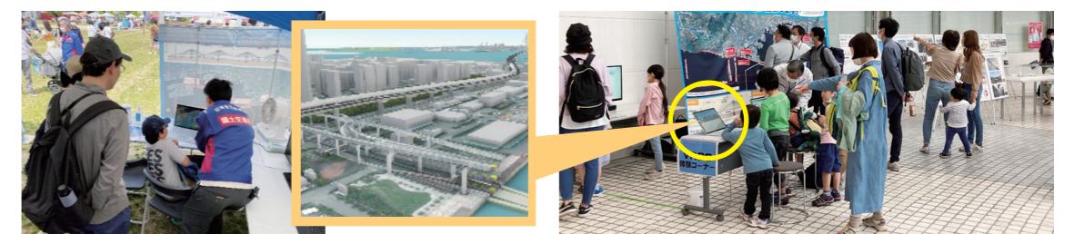
地元広報活動におけるVRCG体験

その3：VR技術を活用した体験型広報 地域の大規模イベントや主要駅にて、ジオラマの展示やCIMモデルの仮想道路の走行体験ができるVRの使用により道路事業の広報活動を行った。参加の皆様からは「CGにより道路の全体像がよくわかった」「完成が楽しみ」といった声をいただき、多くの方に事業をPRすることができた。