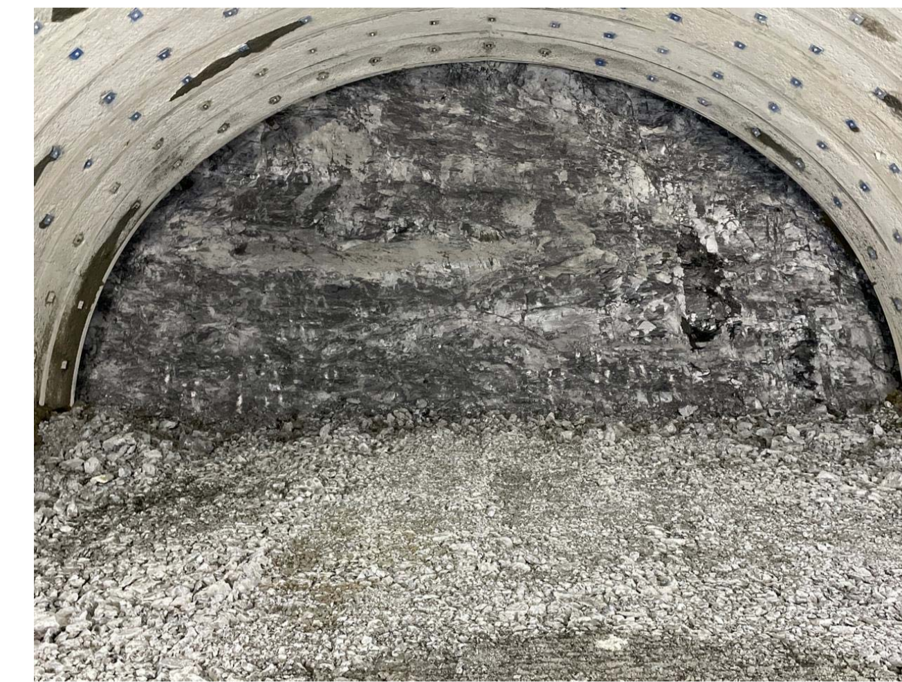
④ 串本町和深(東地トンネル)