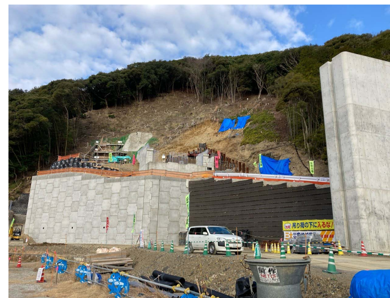
③ 串本町和深(和深西トンネル～和深川橋)