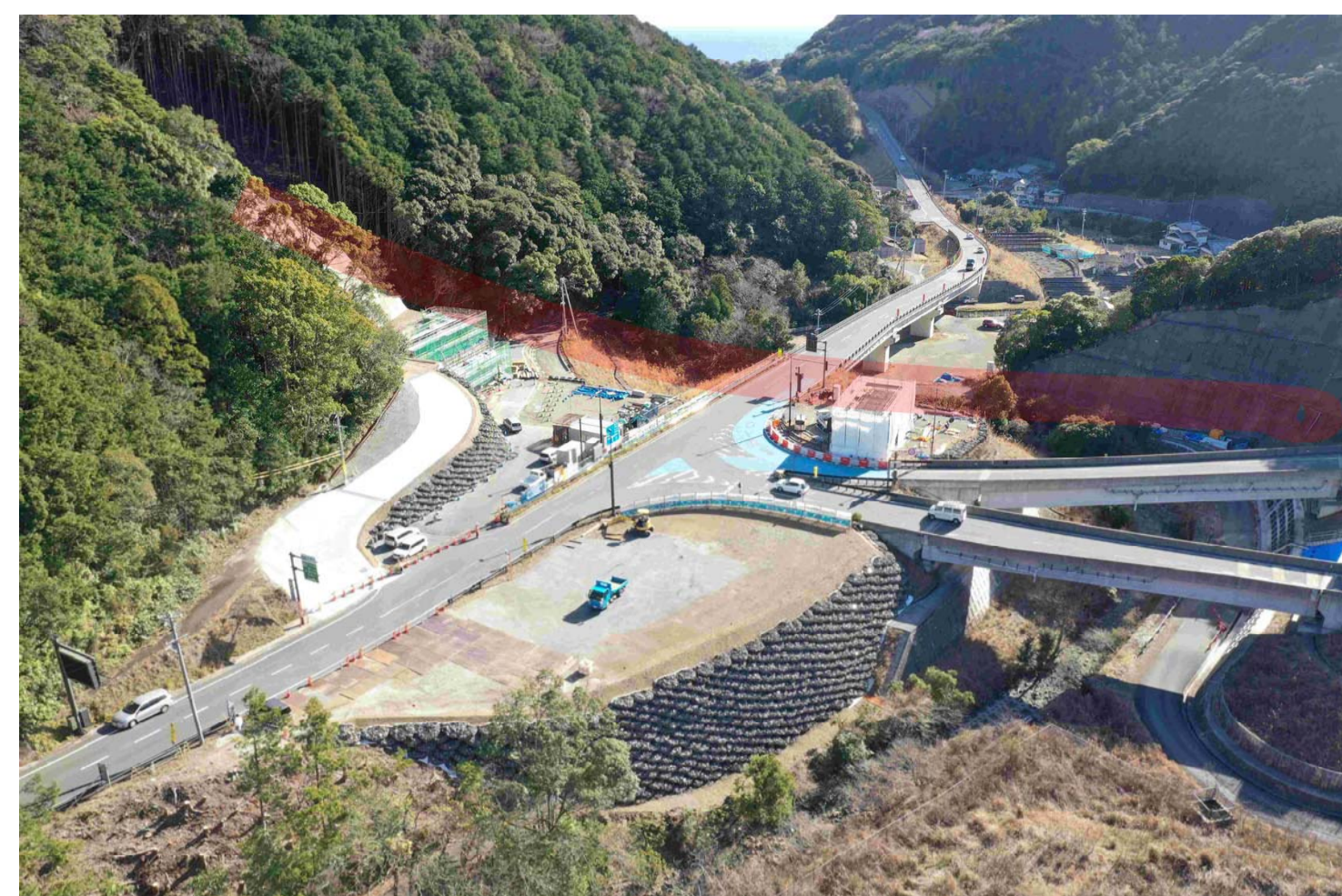
① すさみ町江住(すさみ南IC江住川橋)