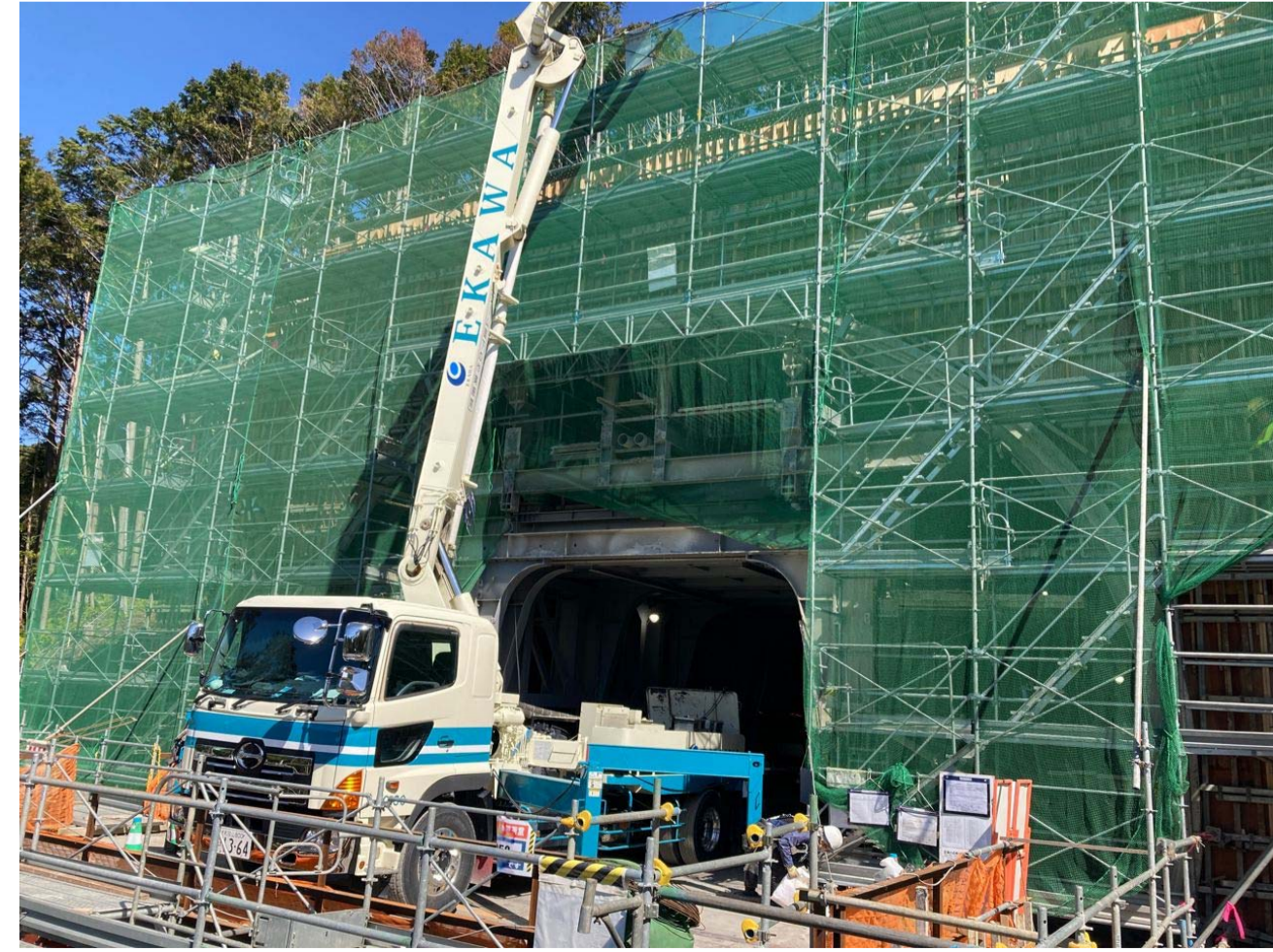
⑥ 串本町田並(田並トンネル)