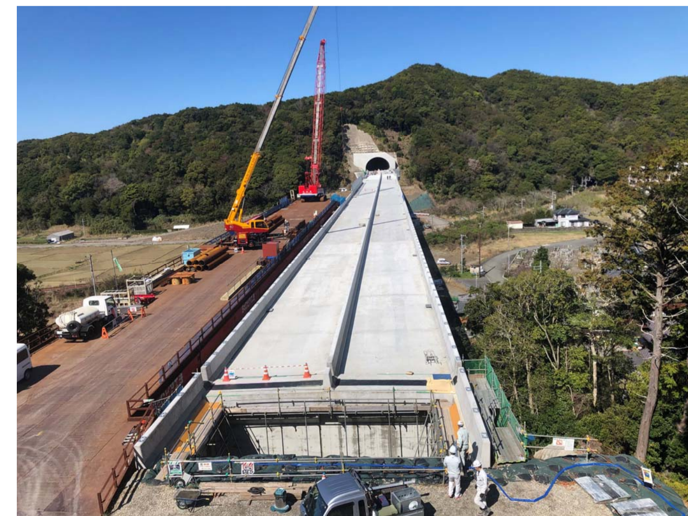
⑦ 串本町二色(二色川橋)