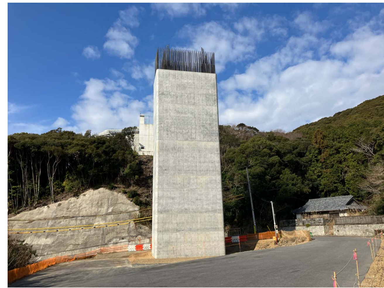
② 串本町和深(熊谷川橋第二橋)