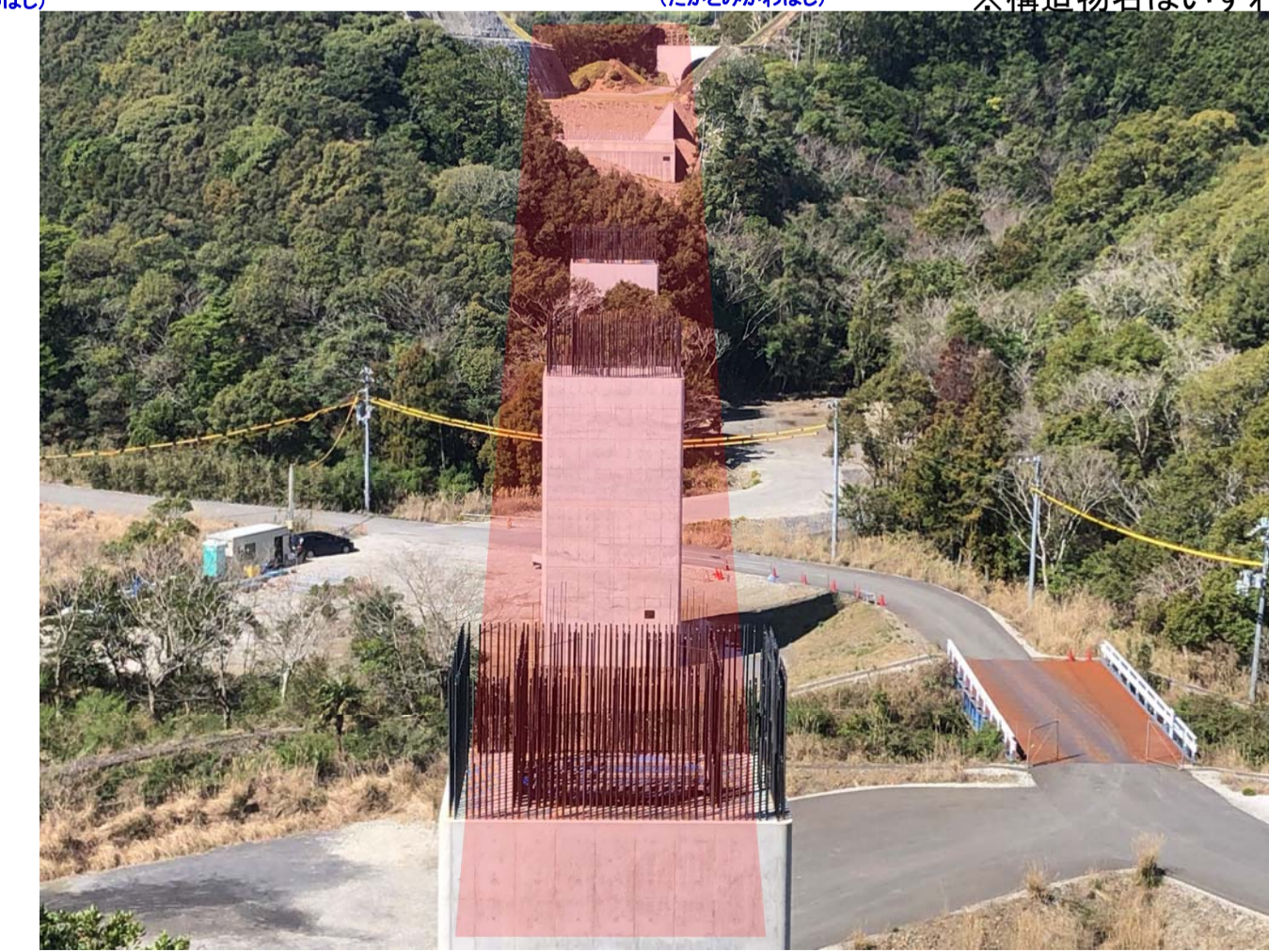
⑧ 串本町關野川(關野川橋) 紀南河川国道事務所