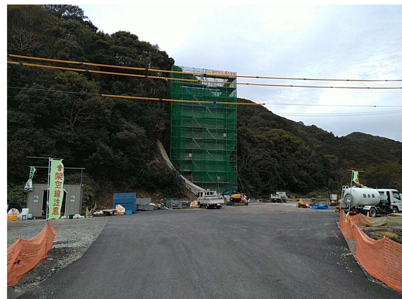
⑤ 串本町江田(江田川橋)