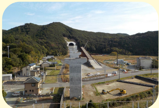
⑥ くしもとちょうたかとも たかともがわばし 串本町高富(高富川橋)