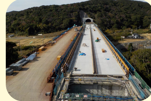
⑦ くしもとちょうにしきにしがわばし 串本町二色(二色川橋)