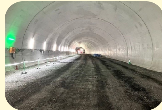
④ くしもとちょうたなみ たなみ 串本町田並(田並トンネル)