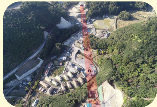
⑤ くしもとちょうありた ありたがわばし 串本町有田(有田川橋)