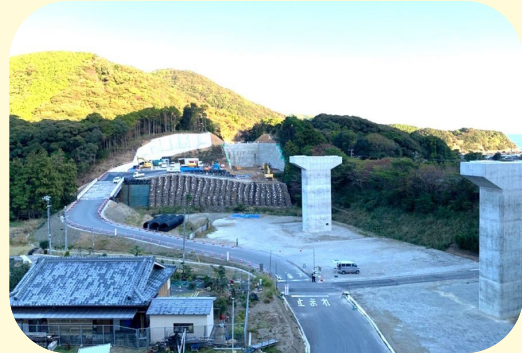
① ちょうさとの さとのにししがわばし すさみ町里野(里野西池川橋)