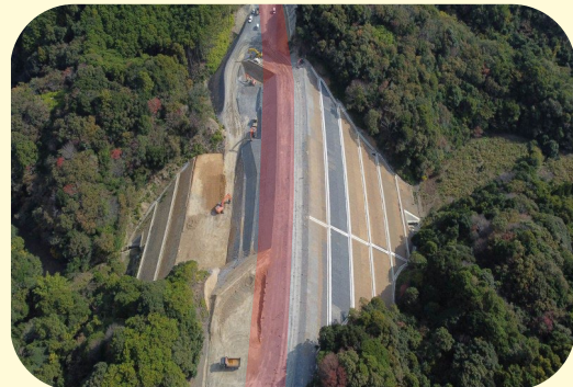
③ くしもとちょうえだ 串本町江田(道路改良)