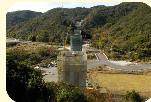
⑧ くしもとちょうくじのかわくじのかわばし 串本町鬮野川(鬮野川橋)