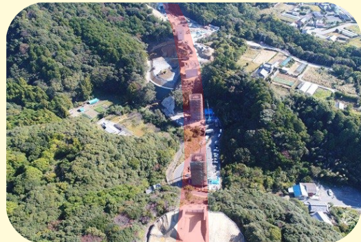
② くしもとちょうわぶか くまたにがわだいにきょう 串本町和深(熊谷川橋第二橋)