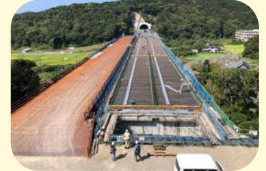
⑦ くしもとちようにしき にしきがわばし 串本町二色(二色川橋)