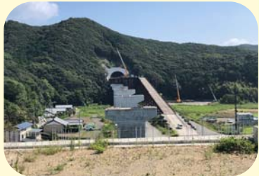
⑥ くしもとちようたかとも たかともがわばし 串本町高富(高富川橋)