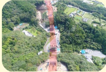
② くしもとちようわぶか くまたにがわだいにきよう 串本町和深(熊谷川第二橋)