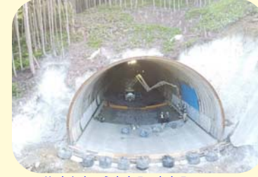
④ くしもとちようたなみ たなみ 串本町田並(田並トンネル)