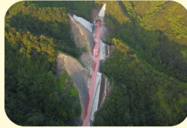
③ くしもとちようたこ どうろかいりよう 串本町田子(道路改良)