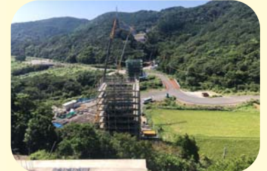
⑧ くしもとちようくじのかわ くじのかわばし 串本町鬮野川(鬮野川橋)