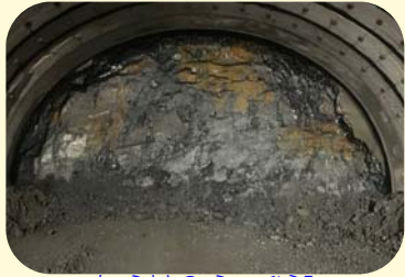
① ちようさどのう ひらみ すさみ町里野(宇の平見トンネル)