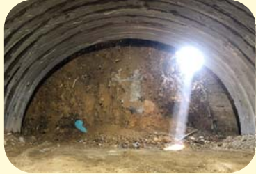
⑤ くしもとちようありた ありたかみだいに 串本町有田(有田上第二トンネル)