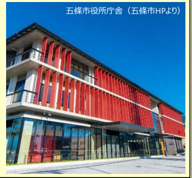
五條市役所庁舎（五條市HPより）