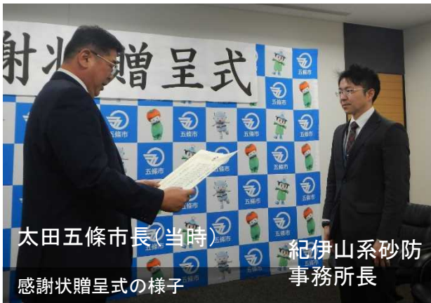
太田五條市長(当時) 紀伊山系砂防事務所長 感謝状贈呈式の様子

現在、五條市内では赤谷地区の対策を進めており、完了に向けて、引き続き鋭意努めてまいります。