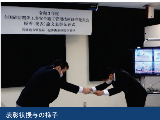
表彰状授与の様子

全国砂防関係工事安全施工管理技術研究発表会実行委員会が主催する発表会において優秀論文に選ばれた発表者に対して、表彰状の伝達式を執り行いました。