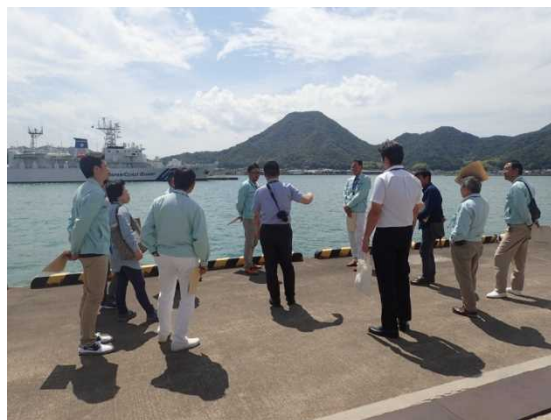
【改良未施工箇所の見学】