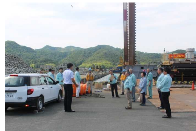
【見学会終了挨拶の様子】