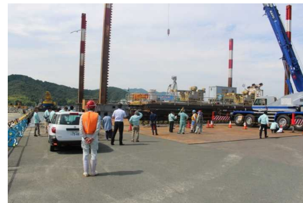
【艀装中の作業台船の見学】