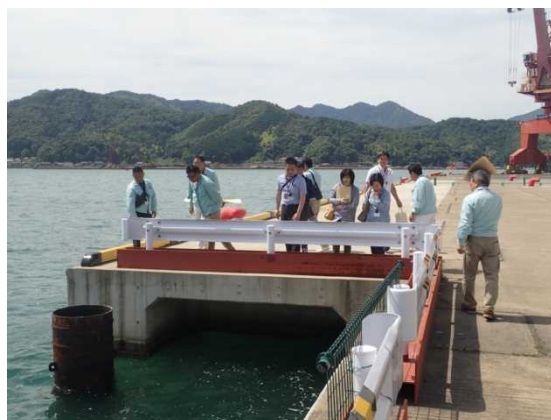
【改良施工済み箇所の見学】