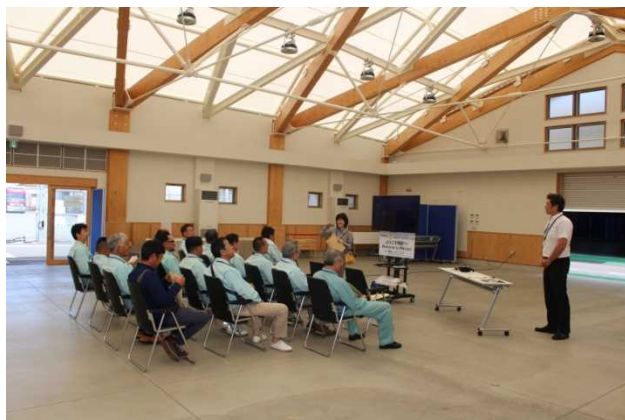
【事業概要説明の様子①】