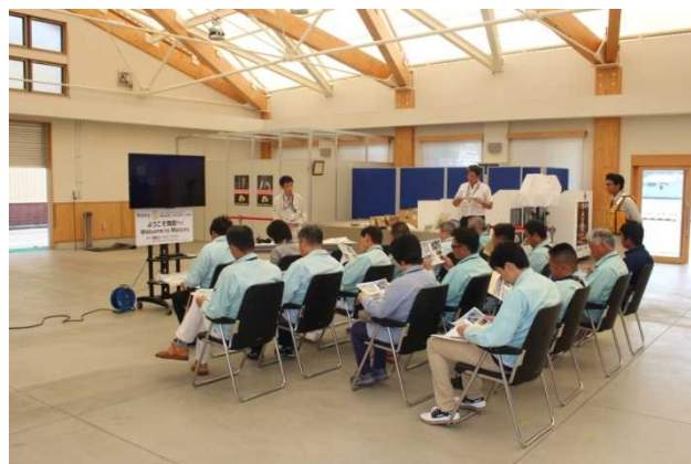
【事業概要説明の様子②】