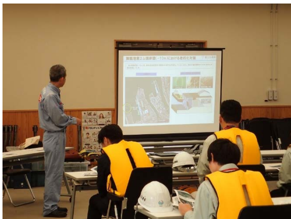
【事業概要説明の様子②】