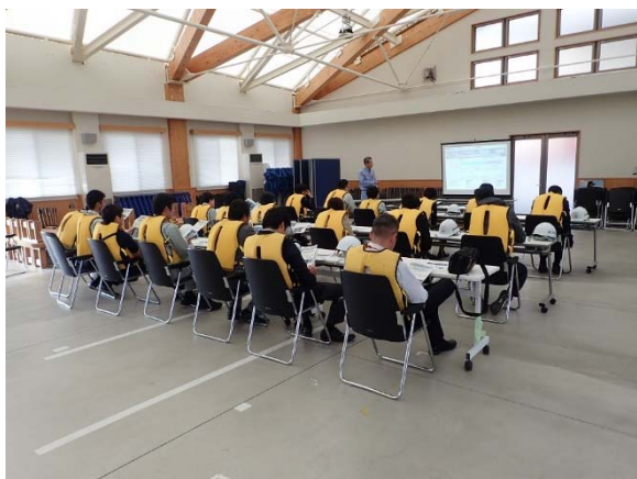
【事業概要説明の様子①】