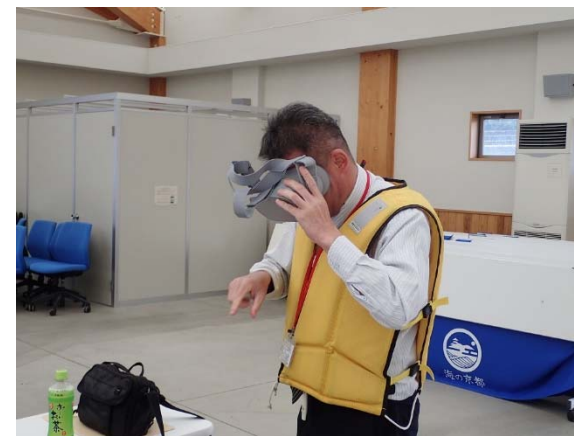
【VRを用いたCIM活用体験】