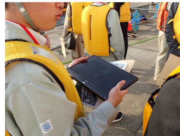
【タブレットを用いたCIM活用体験】