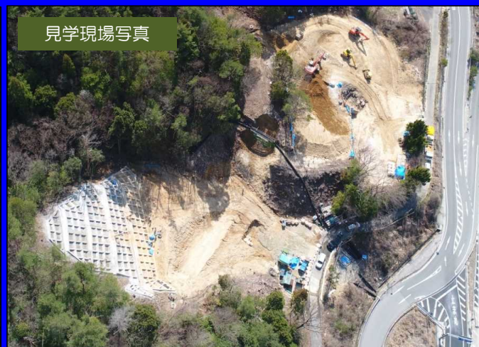
施工現場空撮 (平成30年3月現在)