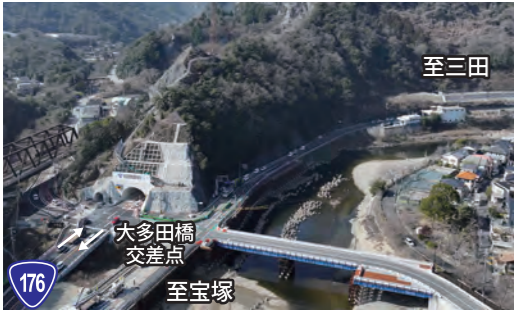
生瀬トンネルに交通を切り替えました。