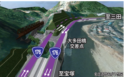
生瀬トンネル三田方面行き(上り)2車線、並行する現道を宝塚方面行き(下り)2車線とする4車線で開通します。