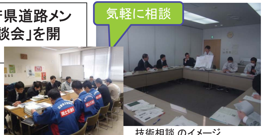
技術相談のイメージ