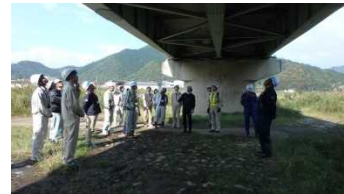
合成桁、非合成桁の見分け方、海外の橋梁設計の考え方など、専門家による解説がありました。