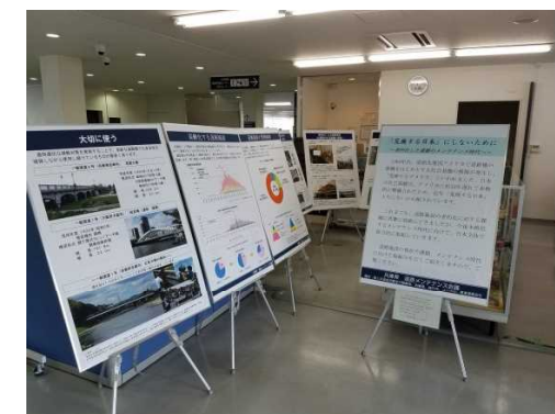
淡路市役所 展示状況