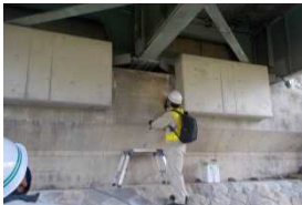
専門家による説明