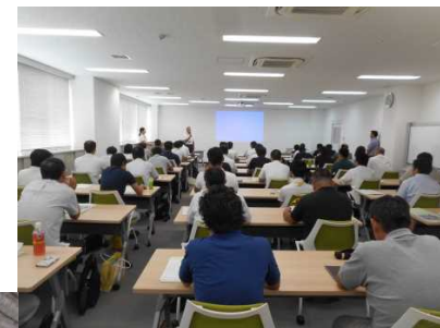
H29実施状況 講習の様子

目 的:橋梁に関する必要な専門知識を習得し、道路管理者としての維持管理技術の向上を図ることを目的に開催