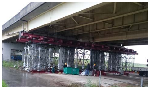
平成28年4月21日9時 応急復旧作業状況