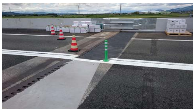
平成28年4月28日12時 応急復旧作業状況（上り）