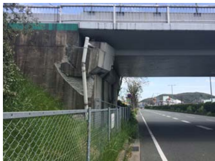
平成28年4月16日11時 被災後の状況