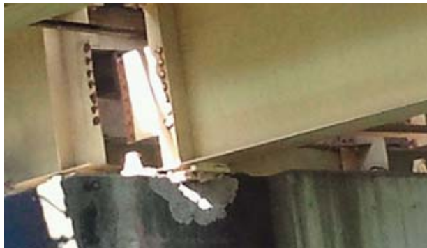
平成28年4月15日10時 被災後の状況