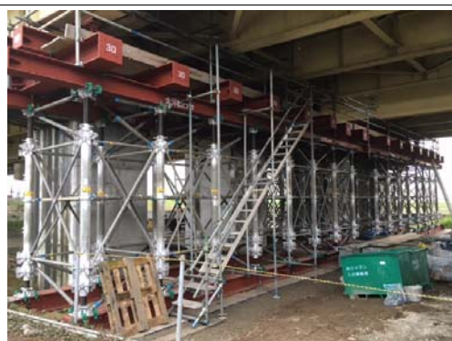
平成28年4月24日10時 応急復旧作業状況