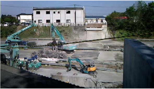
平成28年4月20日13時 撤去作業状況