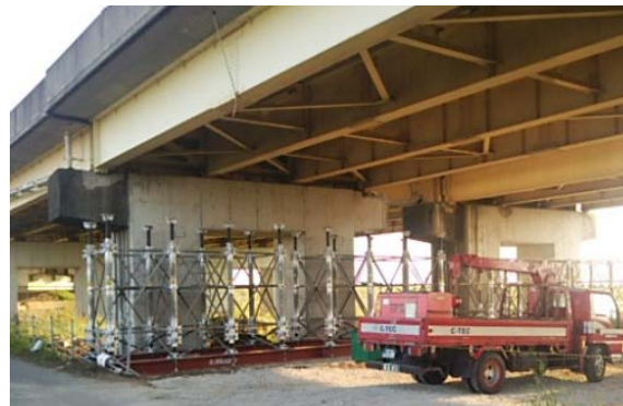
平成28年4月19日16時 応急復旧作業状況