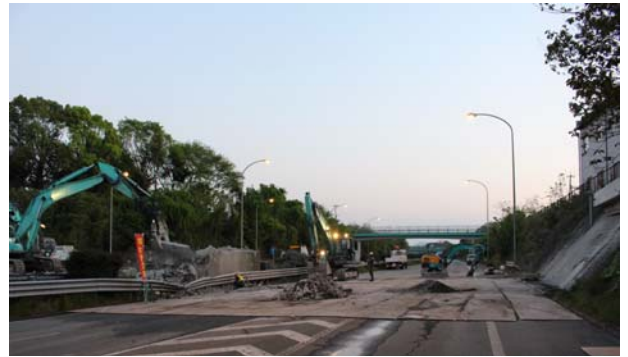
平成28年4月20日19時 撤去作業状況