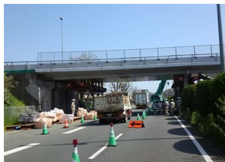
平成28年4月20日10時 応急復旧作業状況