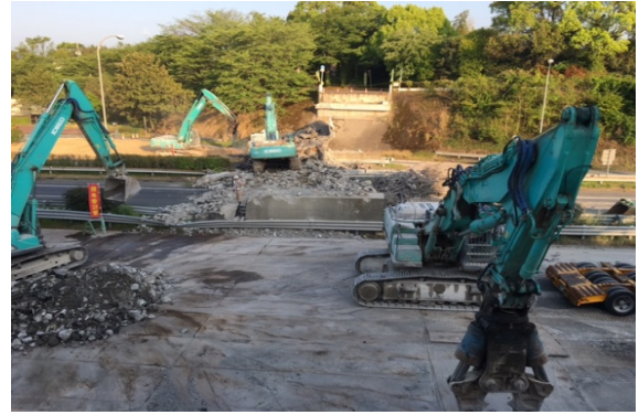
平成28年4月19日15時 撤去作業状況