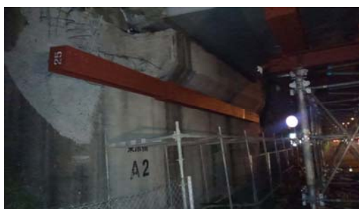
平成28年4月20日21時 応急復旧作業状況