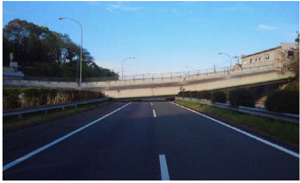
平成28年4月16日6時 被災後の状況