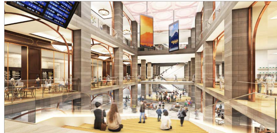
＜待合空間のイメージ(2階・3階の吹抜け)＞

中・長距離バス停の段階的な集約、神戸らしさが演出された充実したバス待合空間の整備とともに、2次交通として、多様なモビリティなども利用できる交通結節点を整備し、乗換・待合環境を改善。