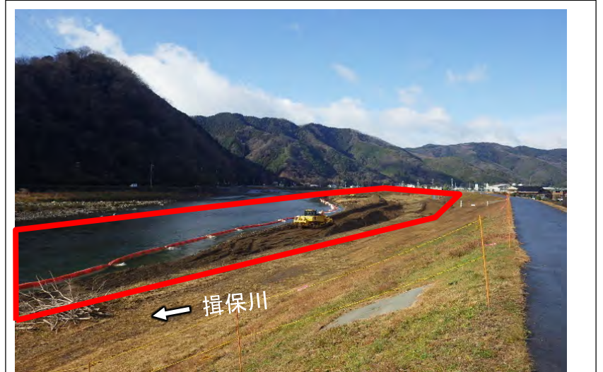
引き続き、樹木伐採、河道掘削を実施